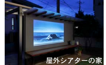
屋外シアターの家