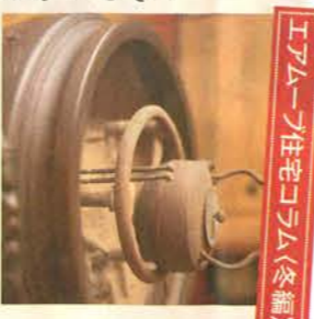
エアムーヴ住宅コラム(冬編)

凍てつく冬、冬の寒さは、昔も今もほとんど変わりありません。にも関わらず、日本の家は長い間、「暖房」というものがありませんでした。西洋のセントラルヒーティングなど、世界的に見れば「暖房」の歴史は長いのですが、日本にあつたのは「火鉢」や「たこ」[囲炉裏]など。部屋全体を暖める「暖房」ではなく、暖をとる「採暖(さいだん)」でしかなかったのです。吉田兼好が「徒然草」で書いた「家の作りやうは、夏をむねとすべし。冬は、いかなる所にも住まる。」を地で行くように、かつての日本人は、夏の過ごしやすさを優先し、冬の寒さをしのぐための暖房には無頓着でした。