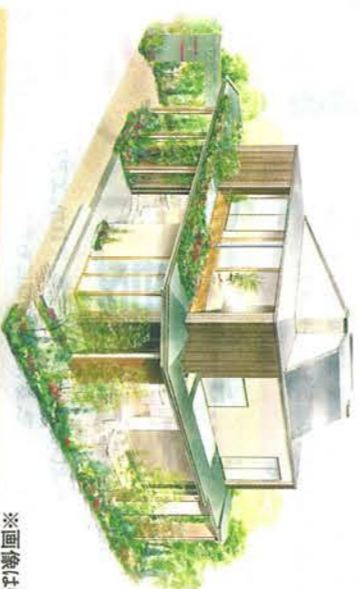
※画像は完成イメージ

何回行っても、そのたびに発見がある。 季節を変えて訪ねると、また新たな魅力に気づく。 そんなモデルハウスをつくりました。 「料理する姿を美しく見せるキッチン」「2階にある“食べられる庭”」 「窓のベンチ”があるキッズリビング”」…。 紙面では伝えきれないアイデアの数々。ぜひあなたの目で発見してください。